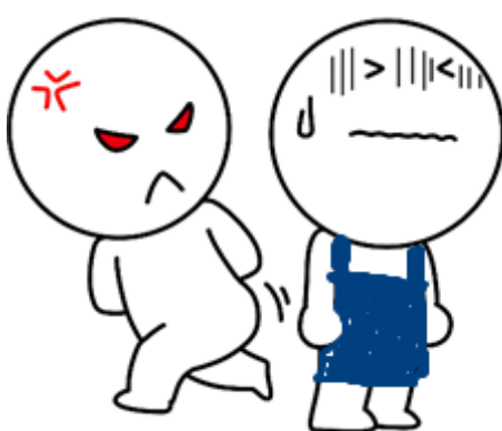
高圧的な態度をとる