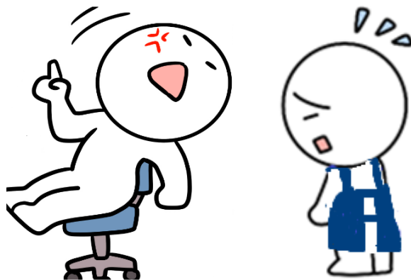
長時間責め立てる