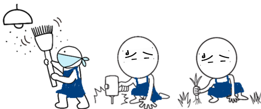
介護保険でできないサービスの要求